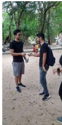
Figura 2 - Alunos distribuindo folder e orientando a comunidade durante a realização da ação de extensão no Parque das Dunas.