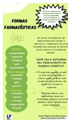
Figura 1 - Folder da ação de extensão sobre medicamento e as formas farmacêuticas.