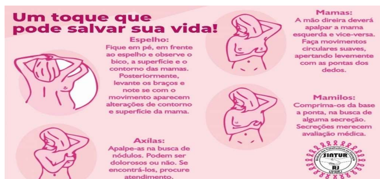
Figura 1 - Folder da ação de extensão sobre o Outubro Rosa (Frente)