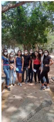
Figura 2 - Distribuição de panfletos na realização da ação de extensão no Parque das Dunas.