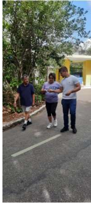
Figura 2 - Alunos orientando a comunidade na realização da ação de extensão no Parque das Dunas.