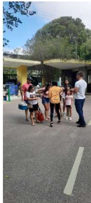
Figura 2 - Alunos na realização da ação de extensão no Parque das Dunas.