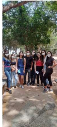
Figura 2 - Alunos distribuindo folder e orientando a comunidade durante a realização da ação de extensão no Parque das Dunas.