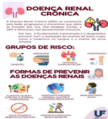
Figura 1 - Folder da ação de extensão sobre a Doença Renal Crônica.