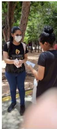
Figura 2 - Alunos distribuindo folder e orientando a população durante a realização da ação de extensão no Parque das Dunas.